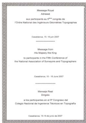
Lettre Royale adressée par Sa l'ONIGT