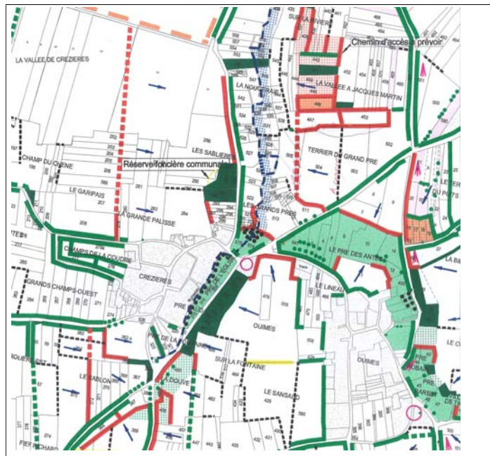
Extrait du schéma directeur

À l'issue de cette première phase, qui peut être longue (6 à 12 mois), est étudié un schéma directeur d'aménagement, qui va fixer des prescriptions à respecter, et un cadre à l'intérieur duquel devront s'inscrire les opérations d'aménagement.